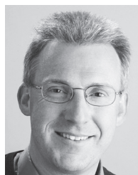
Pascal Fleury Ependes, «La Liberté»